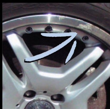
korrosionen efter stenslag.